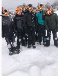
Œuvre d'art faite par nos élèves lors d'une récréation!