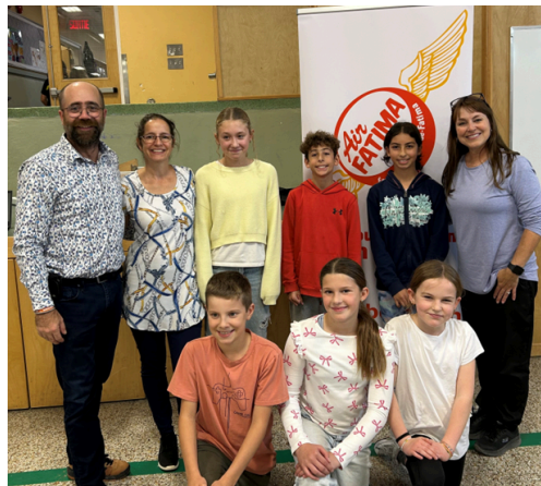
Notre conseil d'élèves