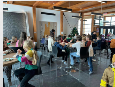
Dégustation de bannique