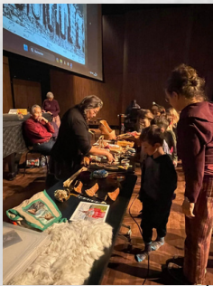
Des magnifiques créations artisanales

Diverses activités ont été vécues en classe et au Centre de musique et de danse durant la semaine du 27 novembre 2023.