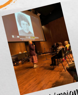
Des aînés témoignent